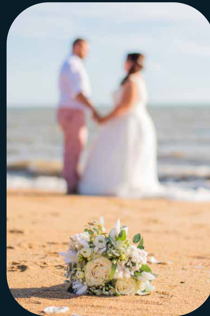
Mariage : Pour que votre jour le plus beau reste gravé en images authentiques.