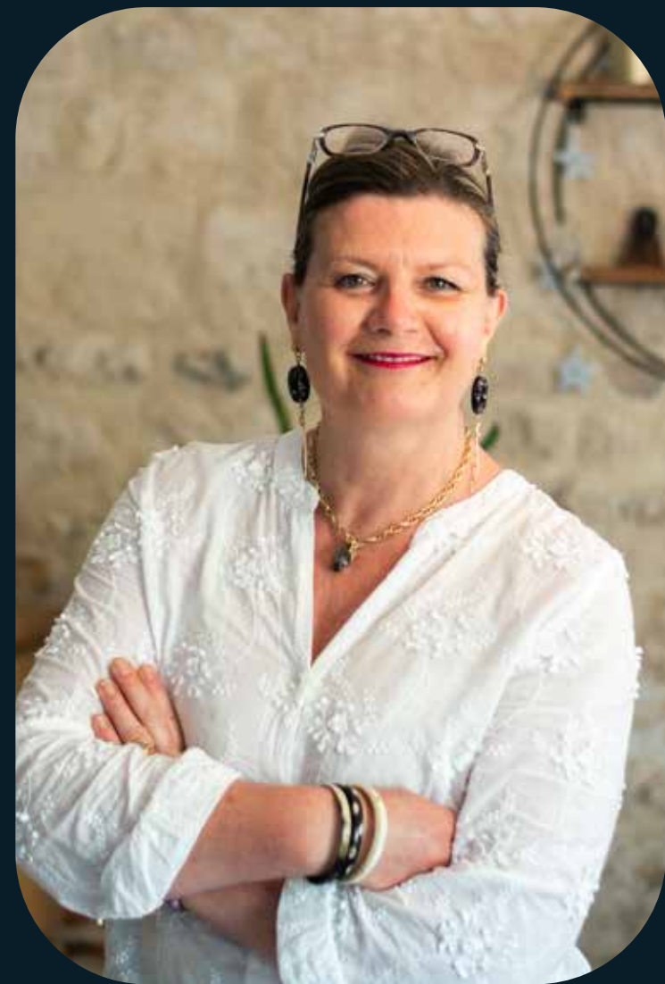
Portrait individuel : Pour capturer votre personnalité dans toute sa splendeur.

Je propose des services variés pour répondre à tous vos besoins :