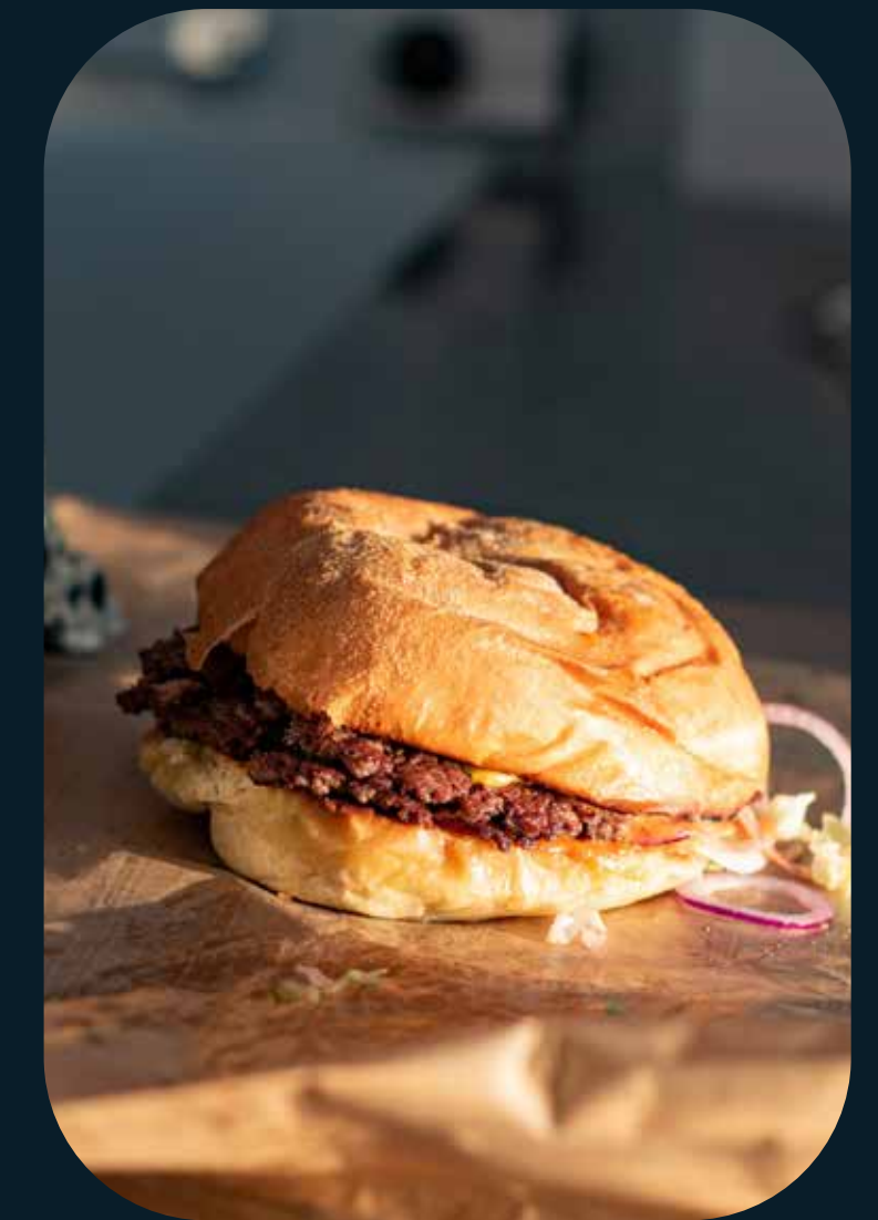
Professionnel : Portraits corporate, événements d'entreprise ou photos pour réseaux sociaux professionnels.