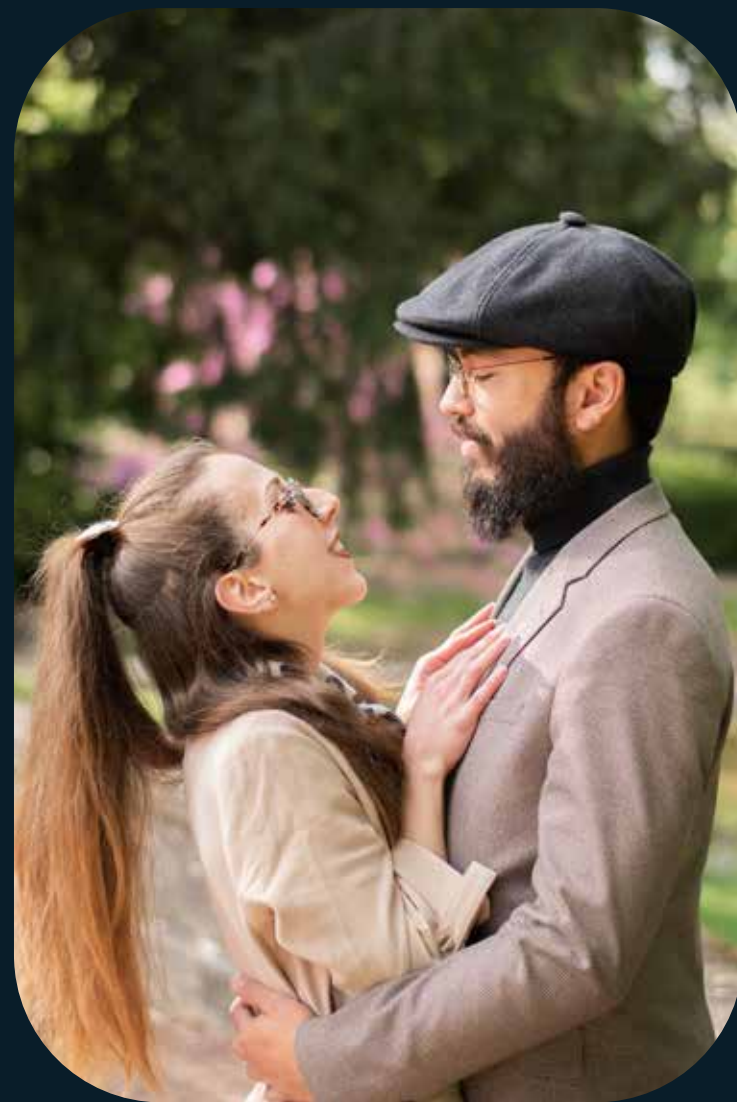
Séance couple : Des moments intimes et complices.