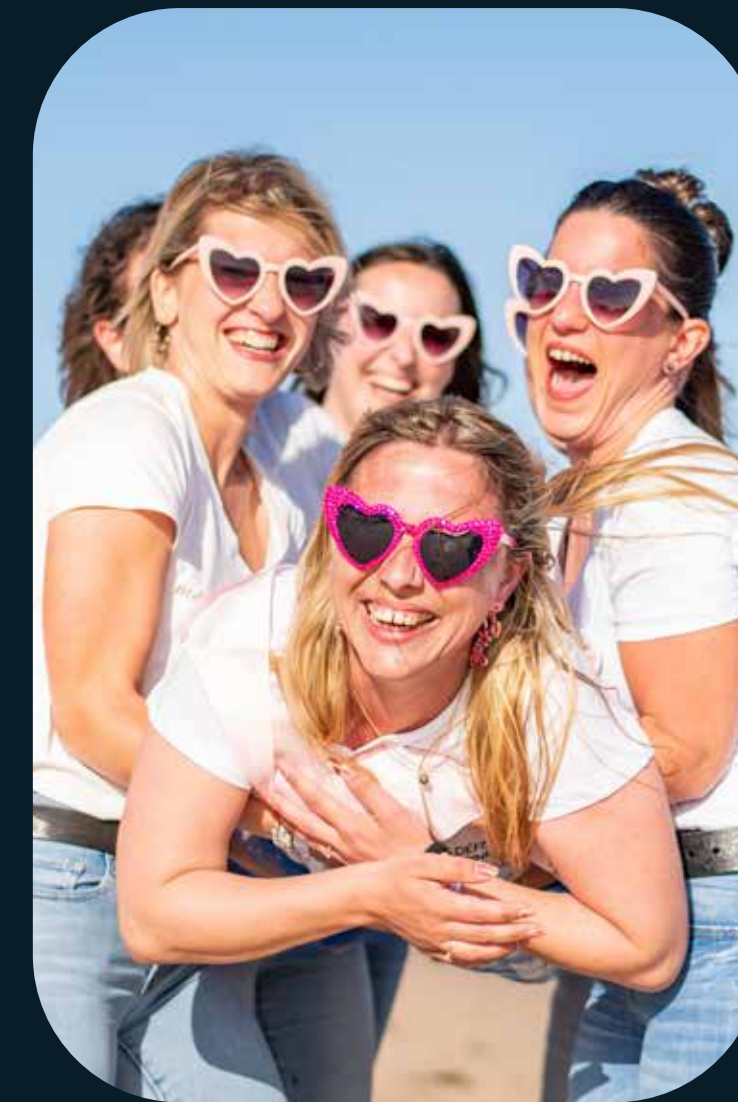
EVJF/EVG : Saisir l'énergie et la complicité de vos moments entre amis.